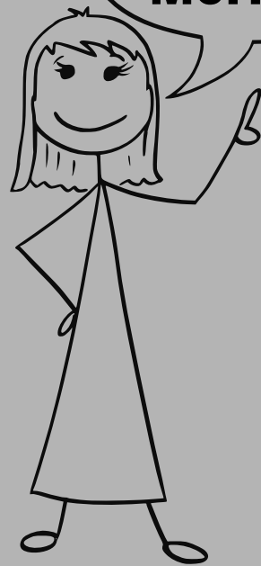
Nombres d'heures : classe bilingue